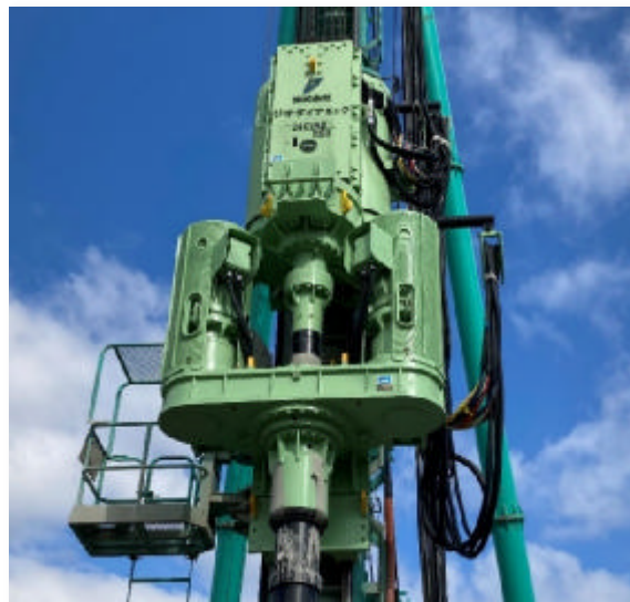
強化型 HYSC 機 電動オーガ