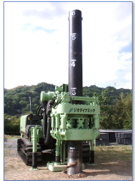
CHR 工法（つばさ杭施工機）

総合施工管理システムにより施工状態（施工深度、掘削抵抗など）を管理室にて施工データを蓄積しつつ、リアルタイムに確認できます。